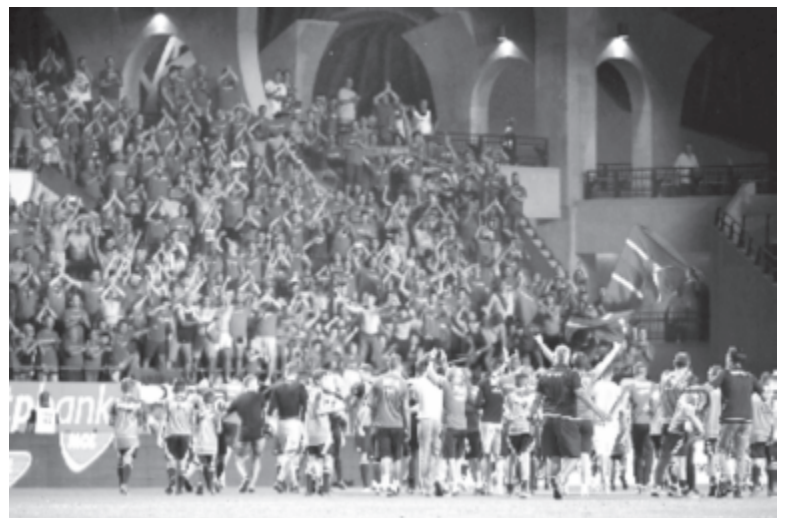
Székesfehérvári szurkolók ünneplik csapatukat a labdarúgó-Európa-liga-selejtező harmadik fordulójában játszott Videoton FC – Girondins Bordeaux visszavágó mérkőzés után a felcsúti Pancho Arénában 2017. augusztus 3-án. A Videoton bejutott a negyedik fordulóba, miután az idegenbeli 2-1-es vereségét követően a visszavágón 1-0-ra győzött.

A Bordeaux fokozta a tempót és a nyomást, de sem a rendes játékidőben, sem a hét perc hosszabbítás során nem tudott a Videoton kapujába találni. A székesfehérváriak a mérkőzés jelentős részében jól játszva, a végén pedig hősiességgel küzdve búcsúztatták esélyesebb francia ellenfelüket.