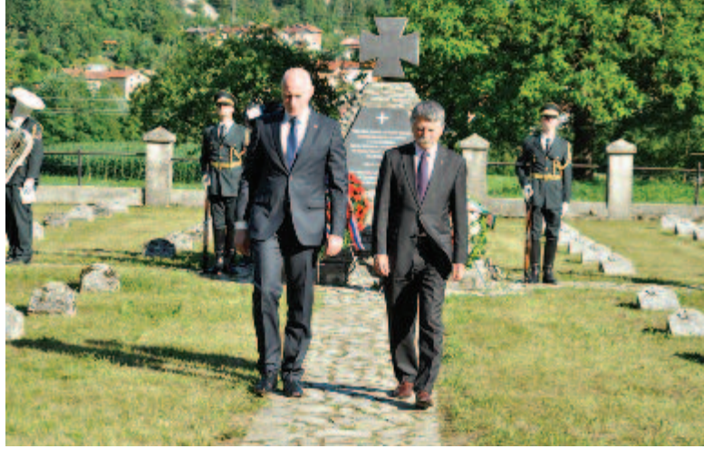
Dr. Milan Brglez szlovén és dr. Kövér László magyar házelnök

A vonat begördül Most na Sociba. Idegenvezetőink tudunkra adják, hogy megemlékező esemény részesei leszünk, így mindenki lesz. Osztrák-magyar monarchiabeli állomásépület fogad. Még a mellék helyiség is régi, amolyan guggolós. Az épület falán óriási há-