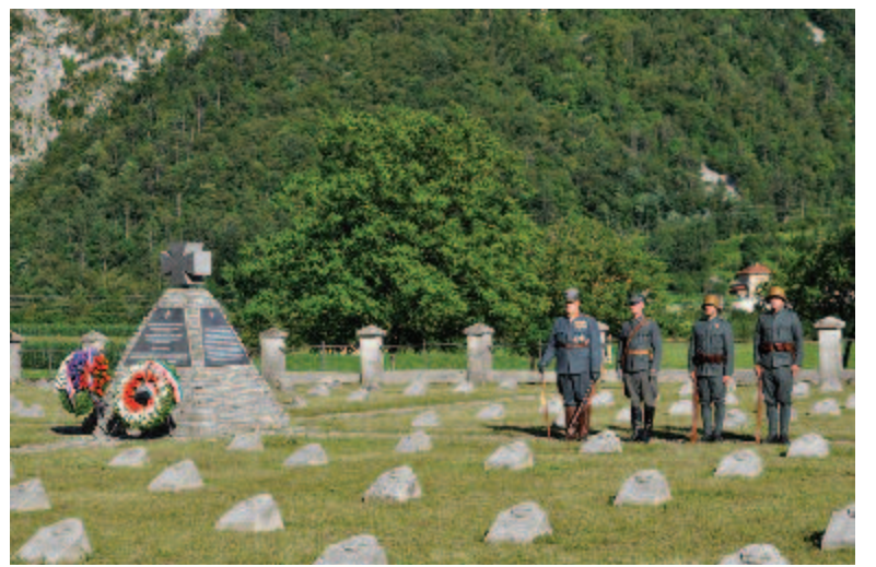
Tisztelgés a hősök előtt

Dr. Milan Brglez, a szlovén Nemzetgyűlés elnöke beszédében kiemelte, hogy „az isonzó front az Alpoktól az Adriáig dicstelenül íródott be a történelembe, mint a legnagyobb hegyvidéki harcszintér az emberiség történelmében. Az első világháború fájó fejezeteként örökké beleivódott a tájba, az itt lakók emlékezetébe. Kitérőlehetetlen nyomot hagyott mindenkiben ez a front, legyen bármennyire távol is ettől. Ezen frontvonal mentén az akkori hazájukat, az Osztrák-Magyar Monarchiát elsősorban magyar katonák védték, akik számos szlovén ifjúval és férfival, más nemzet katonáival együtt ezeken a csatá-reken lettek végső nyugalomra, maguk mögött irt, szomorúságot hagyva. Ma a Béke ösvénye köti össze az emlékhelyeket, amelyek arra figyelmeztetnek bennünket, meg kell tennünk mindent azért, hogy az emberiség történelmének ily sötét fejezetei soha ismétlődjenek meg. Lassan ugyan, de elkezdnek begyógyulni a történelmi sebek, és ez bizonyítja azt is, hogy felül lehet kerekedni a történelmi gyűlölködésen. Az egykori szenvedések és a gyűlölet frontvonala ma a béke, a megbocsátás és a barátság útvonalává válhat” – mondta az elnök, majd hozzátette: a Béke ösvényét az UNESCO világörökség-listájára jelölték. „Legyen könnyű nekik a szlovén föld, dicsőség