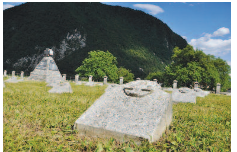
A sírfeliratok eltűntek a történelem viharában

egész XX. századra. Az 1914-ben kitört háború volt az első globális háború, amelyet a korabeli propaganda cinikusán úgy nevezett, hogy a háború, amely véget vet minden háborúnak. Egy évszázad távlatából tudjuk, hogy az első világháború nem vetett véget az öldöklésnek, hanem ellenkezőleg, utat nyitott